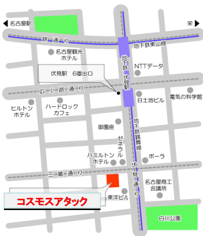
名古屋市営地下鉄 伏見駅下車 6番出口より南へ徒歩5分

ビジネスマッチングサービスに入会ご希望の方は、以下の振込先に金10,500円のご入金をお願いいたします。お手数ですが、宜しくお願い申し上げます。